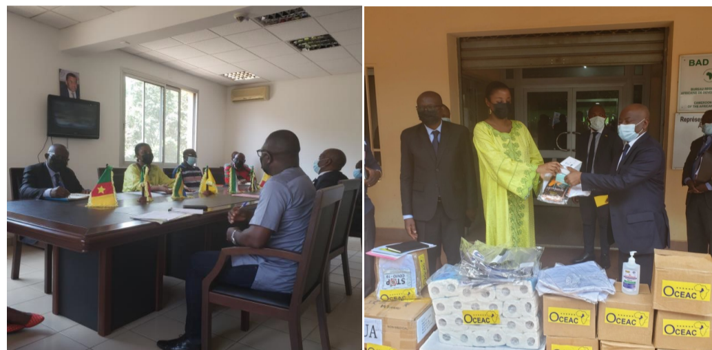
Séance de travail et remise symbolique par le SE de l'OCEAC du matériel de lutte contre la Covid-19 à la

Du 10 au 25 juin 2021, l'OCEAC a effectué une mission de renforcement de la prévention de la Covid-19 au niveau: des Institutions, organes et Institutions Spécialisées de la CEMAC; des Représentations diplomatiques des pays de la CEMAC près du Cameroun, à Yaoundé; et le siège de la CEEAC à Libreville, Gabon. Cette activité a été mise en œuvre conformément à la phase moyen-terme du plan de prévention, préparation et riposte face à la Covid-19, sur financement de l'Aide Budgétaire Globale de la France. L'objectif général est de réduire la propagation de la Covid-19 dans les lieux de travail au sein des Institutions communautaires et Représentations diplomatiques ciblées. Il s'est agi plus spécifiquement de : i) renforcer le dispositif de prévention et surveillance de la Covid-19 ; ii) fournir une dotation en produits et matériels de prévention et sensibilisation sur la Covid-19 dans les lieux de travail; et iii) obtenir l'adhésion des structures communautaires et représentations diplomatiques pour la sensibilisation et prise de conscience sur la maladie afin de freiner les contagions. Ces différentes structures vont ainsi servir de relais pour la sensibilisation sur la Covid-19 à l'endroit de la population. Au total 28 structures communautaires et 05 représentations diplomatiques ont été visitées selon la répartition ci-après (voir encadré ci-dessous):