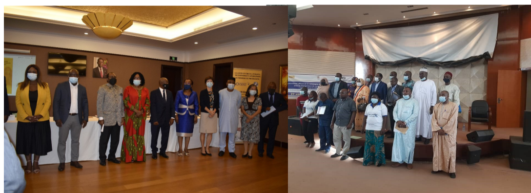
Lancement en Guinée Equatoriale sous l'autorité de la Vice-présidente du Comité Technique National de surveillance et riposte contre la Covid-19