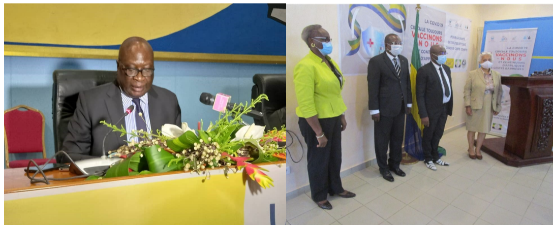
Lancement au Congo par le DirCab du Ministre de la Santé